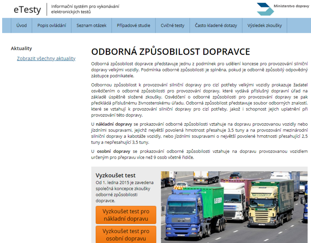
Obr. 1 Informační systém Ministerstva dopravy pro vykonávání elektronických testů; zdroj: eTesty MDČR

aktualizace 29.9.2022. V případě případových studií je to již horší a k datu psaní příspěvku, kterým je říjen 2022 byla poslední aktualizace 26.5.2020.