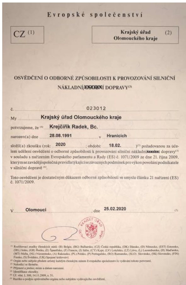
Obr. 6 Osvědčení o odborné způsobilosti k provozování silniční nákladní dopravy; zdroj: Kredoline s.r.o, 2022 Držitel tohoto osvědčení může být odpovědným zástupcem dopravce pro daný druh dopravy. Je poté pod číslem osvědčení uveden v Rejstříku podnikatelů v silniční dopravě, viz obrázek 7 i ve vazbě na daného dopravce.